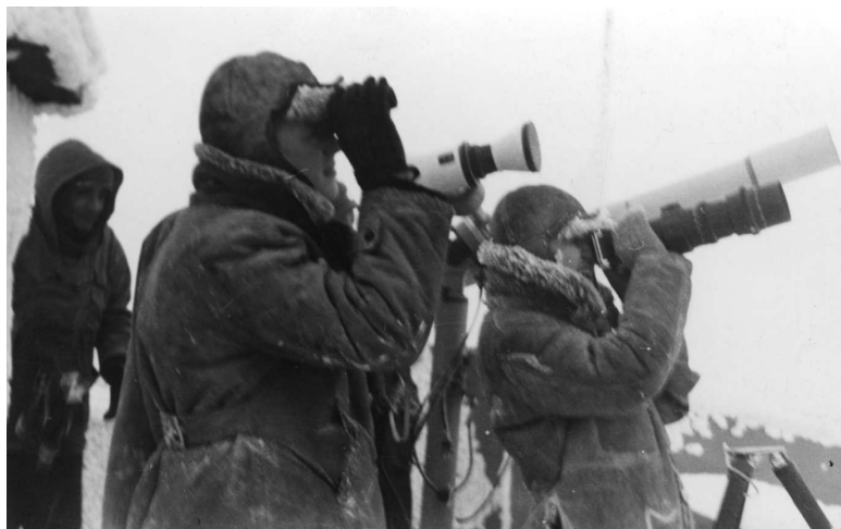
Fig. 5. Екип от старозагорски любители на астрономията наблюдават от вр. Столетов пълното слънчево затъмнение на 15 февруари 1961 г

„С ценното съдействие на др. Ханс Баум и инж. Вайзе от търговското представителство на ГДР у нас бяха доставени от завод „Карл Цайс“ Йена три телескопа: 2 рефлекторни с увеличение до 200 пъти и един огледален с увеличение до 375 пъти. Доставени са също две по-малки тръби за любителски наблюдения, астрокамера, астрофотокамери, апаратури за модерна фотолаборатория и др.“