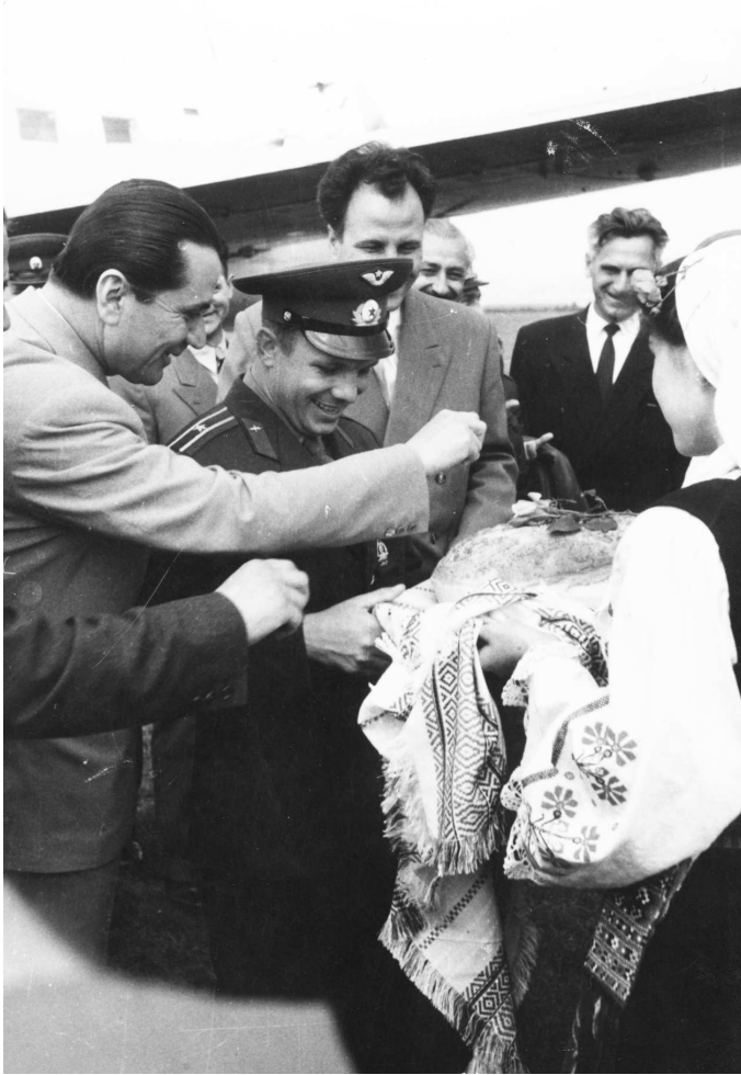
Fig. 1. Първият космонавт Юрий Гагарин на летището в Стара Загора

Стара Загора посреща първия космонавт на планетата (Фиг 1). Той дава съгласието си Старозагорската обсерватория да носи неговото име – Юрий Гагарин.