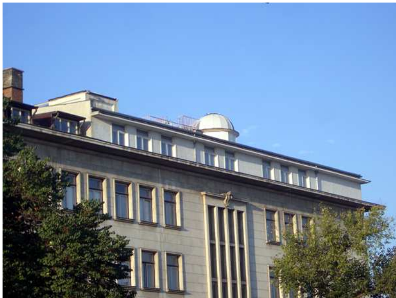
Fig. 8. Една кокетна и удобна надстройка над гимназията “Ромен Ролан” в Стара Загора – такава е днес първата народна астрономическа обсерватория в България, “Юрий Гагарин”, в Стара Загора

реализация. Те са навсякъде по света, но когато посещават роднините си в нашия град, не пропускат да дойдат в обсерваторията, да доведат семействата си, децата и внуците си. Сега Интернет спомага за поддържане на повече контакти. Старозагорските астрономи-любители от няколко поколения вече са голяма общност. Те винаги са оказвали подкрепа и съдействие на институцията, в която са израснали като личности. И това е излизало най-вече в особено тежките моменти, когато съществуването на обсерваторията е било под въпрос.