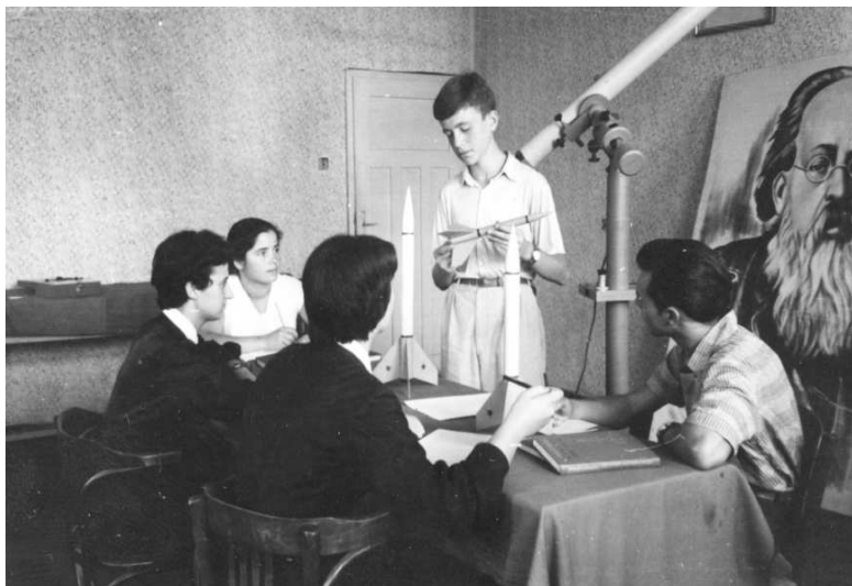
Fig. 2. Занимания в секция Астронавтика към ДОСО Стара Загора, 1960 година

Да се върнем мислено 50 години назад. Небивал ентузиазъм! Очите на всички са устремени нагоре и следят бързо движещите се светли точки на фона на звездите. За първи път изкуствено тяло, сътворено от човешки ръце мери ръст с Природата! Следват множество стартове на ракети с нови изкуствени “луни”. Но възниква необходимост от наблюдаване на движението и промяната в блясъка на изкуствените спътници, в регистриране и предаване на информацията за видимото им състояние в съответния център за космически изследвания. Нужни са редовни наблюдения. Нужни са множество обучени наблюдатели и съответни институции, координиращи тяхната дейност.