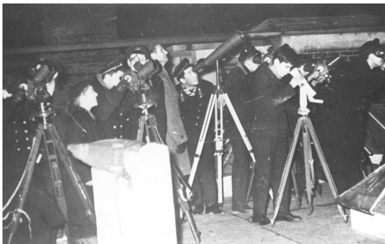
Fig. 4. Първите астрономи-любители в Старозагорската обсерватория наблюдават изкуствени спътници на Земята

с географското място на България и добавя към нея практическо ръководство за боравене с небесни координати. Картата се използва масово и досега.